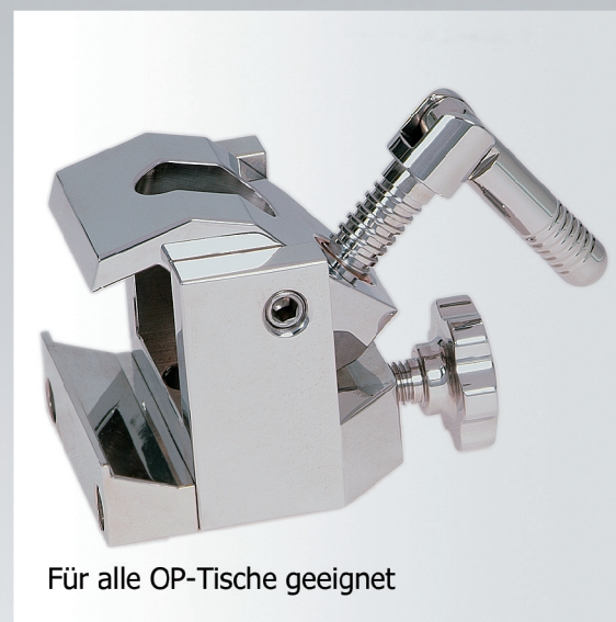
Für alle OP-Tische geeignet