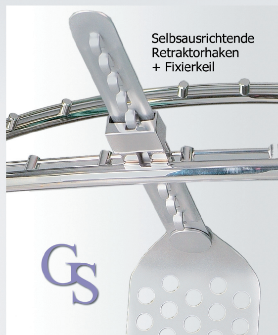
Selbsausrichtende Retraktorhaken + Fixierkeil

Die erhaltene exzellente Exposition durch den GRAY-Leber-Retraktor beruht auf dem "automatischen" Retrahieren des Rippenbogens nach oben und außen.