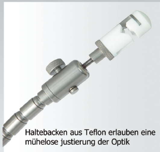
Haltebacken aus Teflon erlauben eine mühelose Justierung der Optik