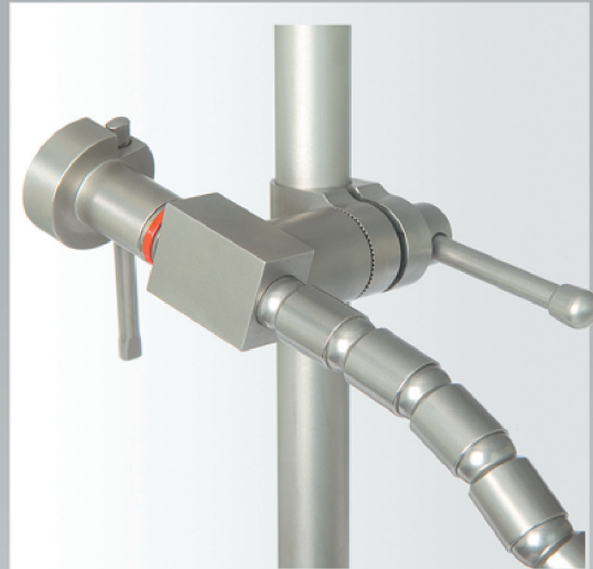
Schneller und einfacher Aufbau des Systems